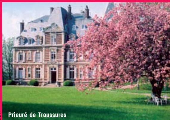
Prieuré de Troussures

Contact : Communauté Saint-Jean Notre-Dame de Cana Secrétariat : 60390 Troussures 03 44 47 86 05 stjean.troussures@wanadoo.fr www.troussures.stjean.com